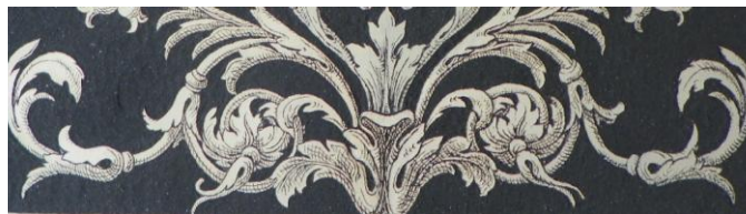
Graffito monocromo su tavola (particolare).

Parimenti all'affresco, è possibile produrre graffiti a fresco anche su supporti mobili, ottenendo così elementi di arredo originali e di ineguagliabile efficacia decorativa.