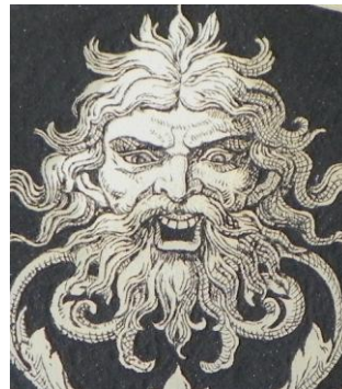
Graffito monocromo su tavola (particolare, 3 giornate di lavoro).