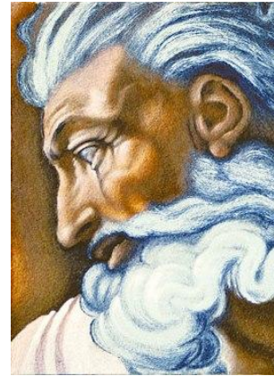
Lavoro terminato (seconda giornata).