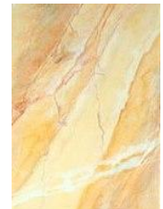
Alcuni finti marmi.