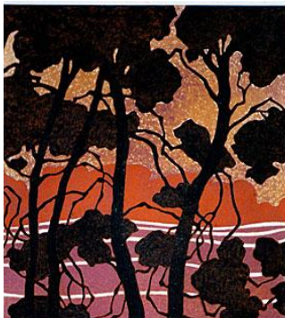
Graffito policromo su tavola (1 giornata di lavoro).