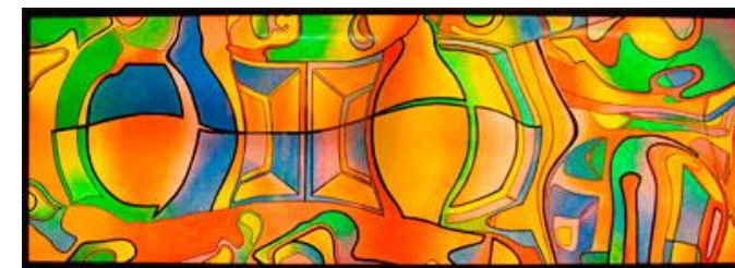
Decorazione su vetro con colori coprenti e trasparenti ad olio. Lavoro già installato e retroilluminato (sottopasso stazione di Firenze SMN).

L'arte germoglia dall'opera dell'artigiano e l'abilità artigianale è già più di un semplice presupposto dell'arte. (William Morris)