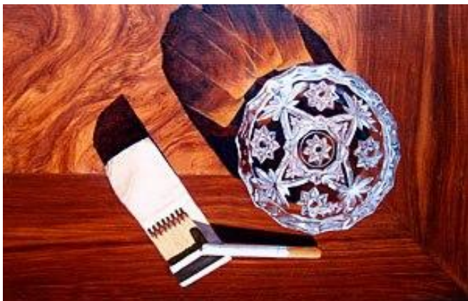
Pittura ad inganno su finto legno (particolare).