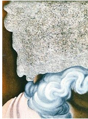
Affresco dipinto su tavola (prima giornata di lavoro).

La pittura murale per antonomasia, che attualmente, con piccoli accorgimenti tecnici, è finalmente possibile realizzare anche su supporti mobili relativamente leggeri.