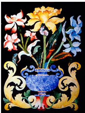
Finto commesso di pietre dure su supporto ligneo.