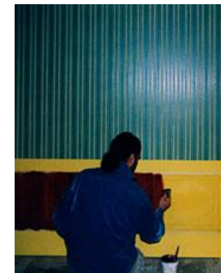
Preparazione di boiserie in legno dipinto con finto parato a righe.