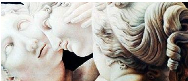
Pittura ad olio.