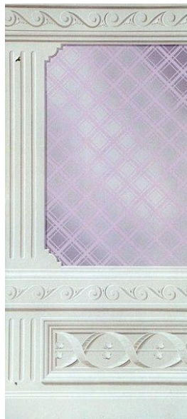
Membrature architettoniche chiaroscurali con stilemi a ornato e parato in finta seta.

Abilità esecutiva sufficiente a realizzare professionalmente l'articolato pittorico descritto.