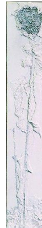
Iconografia con rilievi realizzati in pastiglia (da E. Schiele).

Lavoro concluso con finiture in foglia d'oro e colori ad olio.